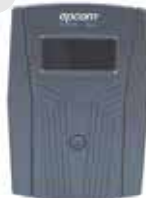
EPU-850-LCD Dim: 100 x 280 x 140 mm